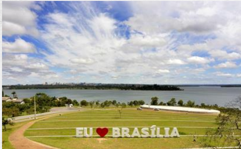
Capilla Dom Bosco