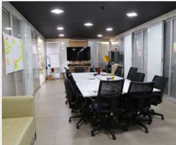
Laboratorio de innovación - GNova