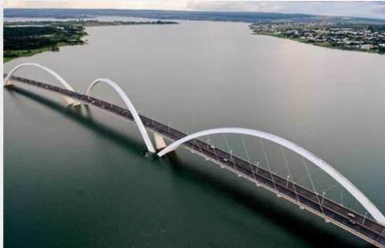
Puente Juscelino Kubitschek