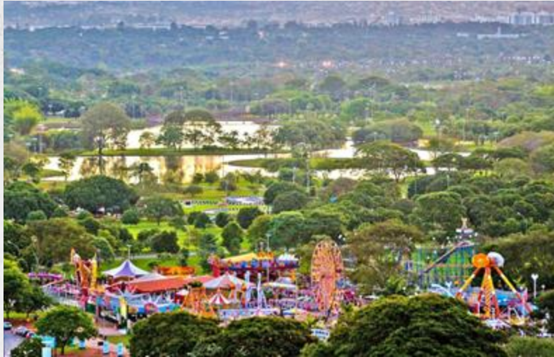
Parque de la ciudad Sarah Kubitschek