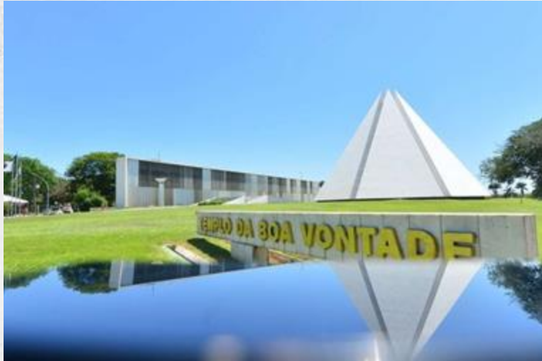
Templo de la Buena Voluntad